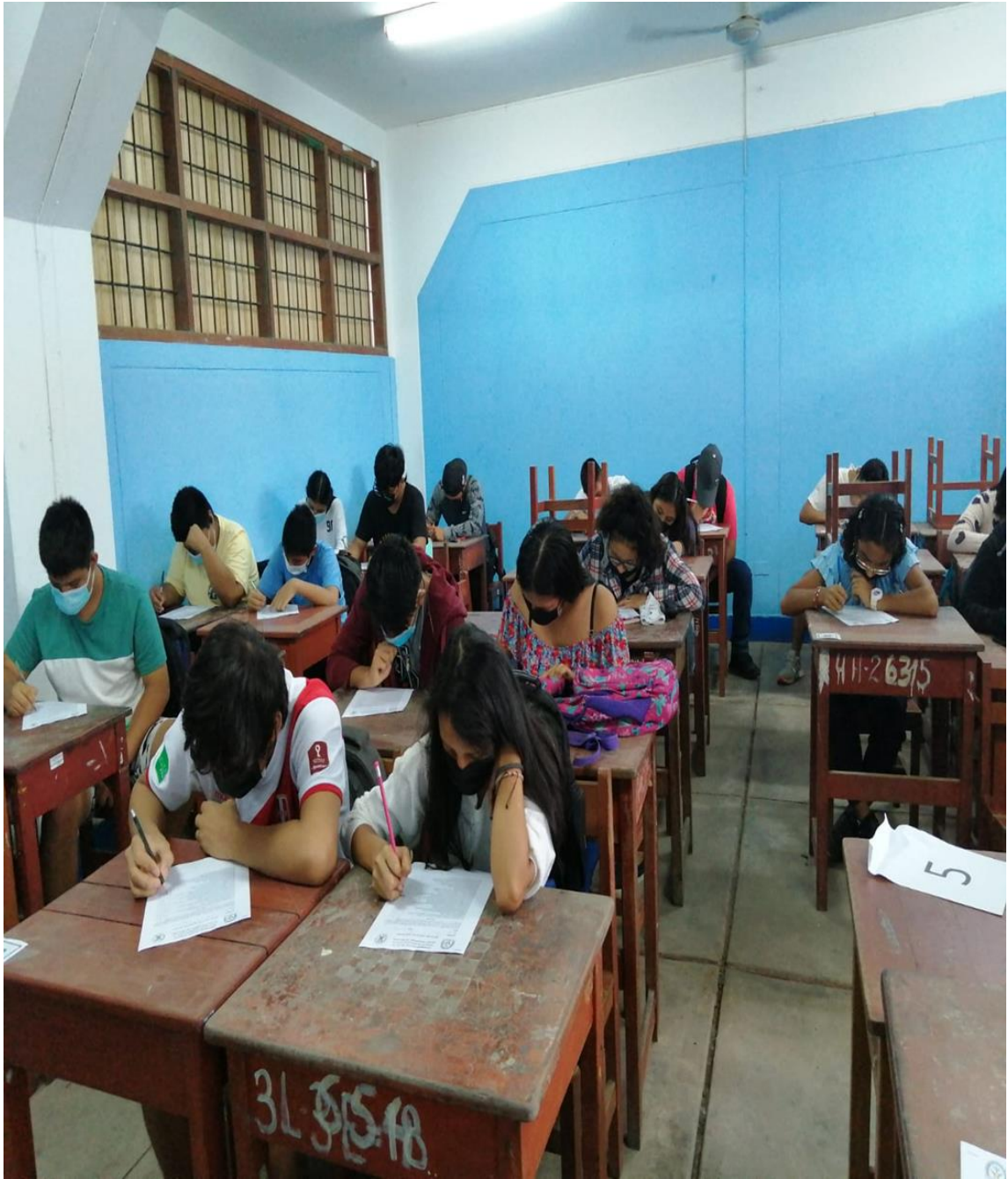
Adolescentes del Centro Pre Universitario Municipal de Pucallpa. 2022.